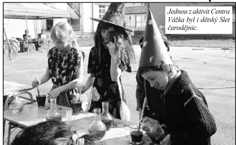
Jednou z aktivit Centra Vážka byl i dětský Slet čarodějnic.