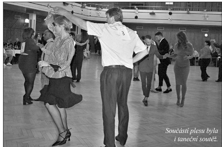
Součástí plesu byla i taneční soutěž.