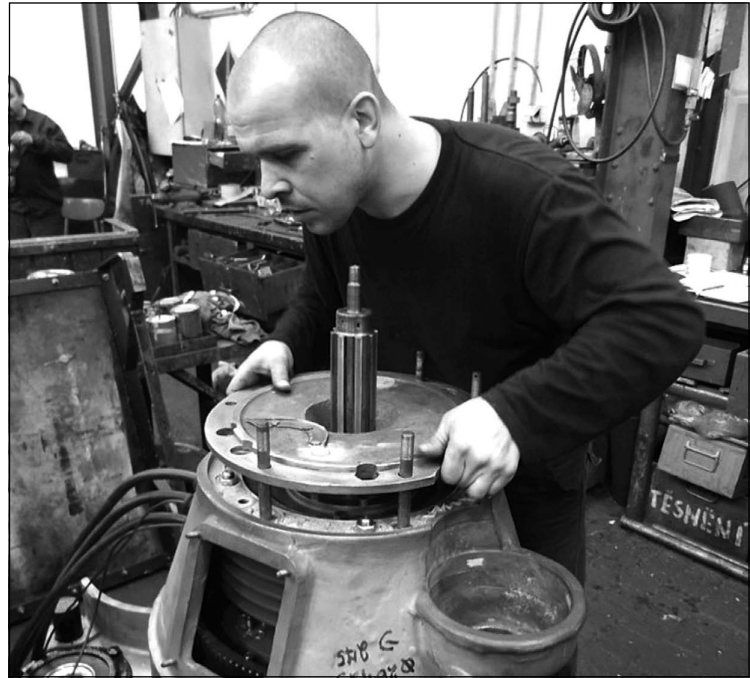
Montáž ložiskového štítu pohonu Slovenské strelly v dílnách MEZ opravny Vsetín.

moderním pavilonu muzea Tatry v Kopřivnici. Součástí expozice bude i výstava originálních součástí lokomotivy, jež zdokumentují technické myšlení vynálezců a konstruktérů, i dovednost pracovníků, kteří byli opravdovými mistry svých profesí. -jž-